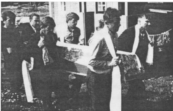
Kuva 2. Arkkua kannetaan liinoilla Sellin Präkkillässä vuonna 1973.