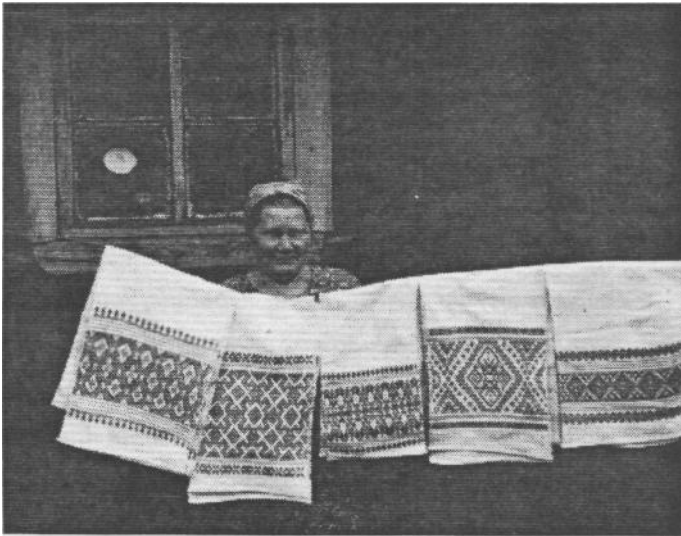
Kuva 6. Pohjoisaunukselaisia käsipaikkoja Paatenen Sellin kylästä.