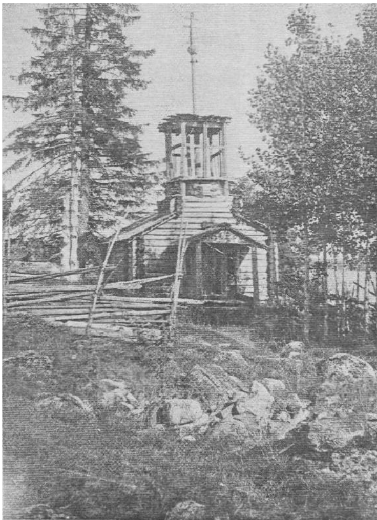
Kuva 8. Rukoushuone Kontokin Akonlahdessa. - Venäjän etnografinen museo, 1927, L. Kapitsa.

Kuten tässä oli jo monesti korostettu, tekstiilien rituaalinen käyttö oli usein yhteydessä puuhun. Eri tilanteilla oli ominaista joko karsikkopuun tekeminen, uhrien vieminen puuhun, juhlien pitäminen puun taikka palvotun lehdon vieressä jne. Aika tavallista on ollut, että liinavaatteet vietiin suoraan puuhun. Puulla ja liinalla muutenkin näyttää alkukantaisessa maailmankuvassa olleen jokin salaperäiseltä tuntuva yhteys: vienäläisessä sadussa metsäpirttiin joutunut neito kutoo kaunista käsipaikkaa käyttäen lankoina puunjuuria. 75 Niin ikään vienäläisessä runossa Iso tammi rinnastetaan "liinaan" eli hamppuun. 76 Myös virolaisissa Ison tammen runon toisinoissa kaadetusta jättiläispuusta syntyy mm. itkuliina 77 jne.