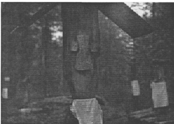
Kuva 7. Paanajärven Kuren kylän hautausmaalla. – Kuva A. Terjukov, 1981.

Puussa oli myös Virtarannan mainitsema oksa ja jopa monta metriä pitempi. Oksan haarasta pitkin