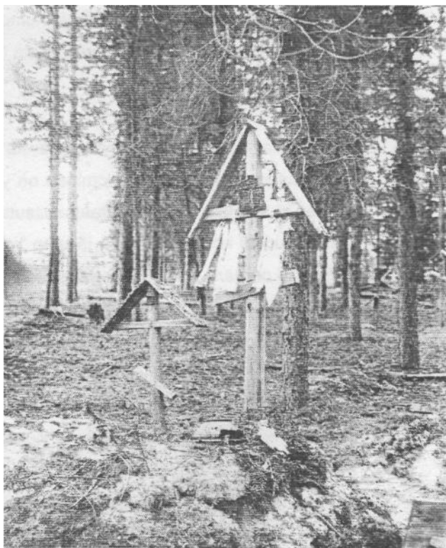
Kuva 3. Tuulipaikkoja Uhtuan Tsiksan kylän kalmismaalla. — Venäjän etnografinen museo, 1926, D. Zolotarjov.

Käydessäni Vuokkiniemen hautausmaalla vuonna 1979 sroitsan (helluntain) jälkeen oli jokaisen haudan multiin pistetty muutama koivunoksa. Risteihin ja hautapylväisiin oli sidottu uusia tuulipaikkoja, joita olivat