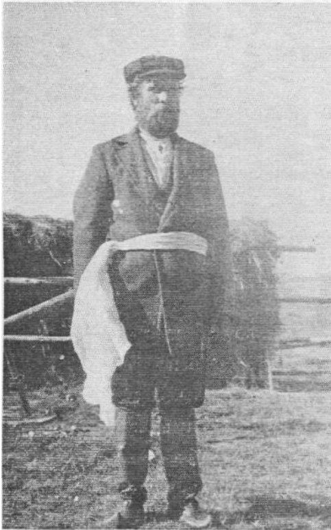
Kuva 1. Pat´vaska Vuokkiniemen Kivijärvellä.

Perinteisten häiden johtajana Karjalassa oli toiminut hääseremonian viettoon erikoistunut tietäjä, tulevan pariskunnan suojelija, kahden suvun yhteensaattaja pat´vaska . Uhtuan Jyväskylähdessä pat´vaskalla oli vyötäisillään pitkä valkoinen käsipaikka. Pat´vaskan ruuskana oli keppi, jonka päähän oli sidottu siipioravan eli liito-oravan nahka. 2 Käsnašauva kädessä, " sata pahkoa sauvassa " pat´vaskan paikka vyöllä hän liikkui " juhlallisen arvokkaana ". Tällaisena tavallisesti nähtiin pat´vaska Kontokin ja Vuokkiniemen kylissä. Pitkä käsipaikka sidottiin vyötäisille, niin että solmu tui vasemmalle puolelle. Paitsi käsipaikkaa, jonka hän sai silloin kun sulhaiskansalle jaettiin lahjat morsiamen kotona, sai pat´vaska vielä palkkansa palttinaisen paidan. 3