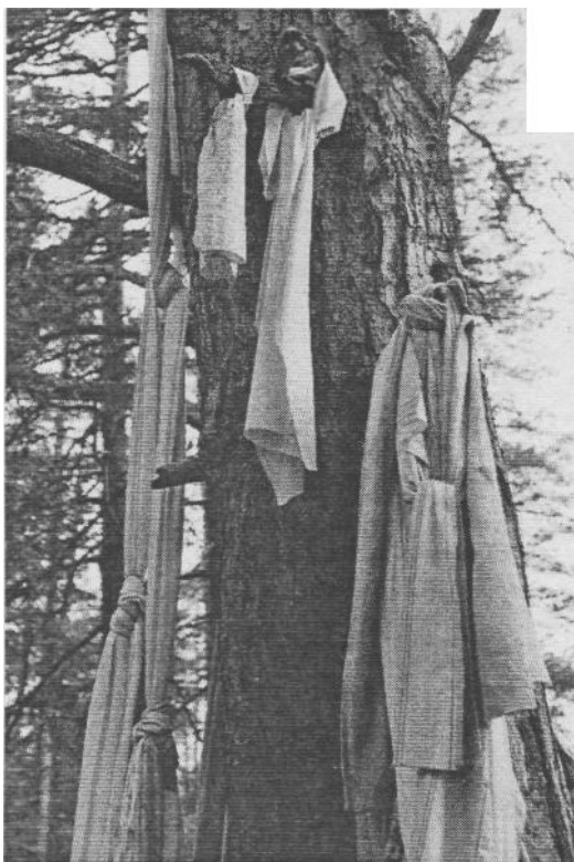
Kuva 4. Tiiksin Rokatsun uhrimännyn "vaatetusta".

Melkein poikkeuksetta kaikilla karjalaisilla hautausmailla löytyy liinoja, kangaskaistaleita tai käsipaikkoja sidottuina hautojen vieressä oleviin puihin. Puista liinat löytyvät myös sellaisen hautapaikan vieressä, jossa ei enää muuta muistomerkkiä ole. Näin vaatekappaleet siirtyvät risteiltä puihin ja ikään kuin perivät hautaristiltä takaisin alun perin puulle osoitetun uhrin. Tavallista on, että vaate kääritään puunrungon ympärille ja sidotaan solmuun haudan puolelta. Puissa, kuten risteissäkin (taikka seipäissä hautojen päällä), on usein monta kerrosta eripituisia ja erikokoisia kangaskappaleita, joskus ne ovat vain kaitoja parin sentin levyisiä suikaleita, joskus taas koko ristin peittäviä tai paksunkin puun ympäri yltäviä kuponkikankaan kappaleita. Usein kalmistojen puut, joista liinat löytyvät, ovat karsikkoja. Etenkin Vienassa ja Pohjois-Aunuksessa erimuotoisia vainajan karsikkoja on lähes jokaisella hautausmaalla 58 .